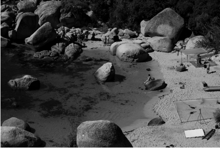
Catalogue Set # VIII Julian Faulhaber