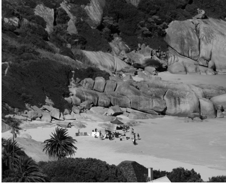
Catalogue Set # VII Julian Faulhaber